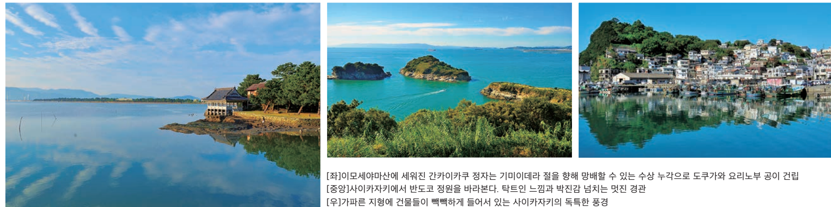
[좌]이모세야마산에 세워진 간카이카쿠 정자는 기미이데라 절을 향해 망배할 수 있는 수상 누각으로 도쿠가와 요리노부 공이 건립 [중앙]사이카자키에서 반도코 정원을 바라본다. 탁트인 느낌과 박진감 넘치는 멋진 경관 [우]가파른 지형에 건물들이 뿔뿔하게 들어서 있는 사이카자키의 독특한 풍경

와카노우라는 와카야마 시가지의 남쪽, 와카가와강 하구의 개펄을 중심으로 사이카자키와 구마노 참배길 기이지·후지시로사카까지 펼쳐져 있는 역사 깊고 풍광이 수려한 지역. 만엽집에 수록된 시인 야마베노 아카히토나 가키노모토노 히토마로를 비롯한 여러 문인과 묵객들의 사랑을 받으며 와카로 읊어진 경승지입니다. 마음을 울리는 서정적인 풍경은 시대를 가리지 않고 사람들을 매료시키며, 다양한 예술의 모태가 되어 왔습니다.