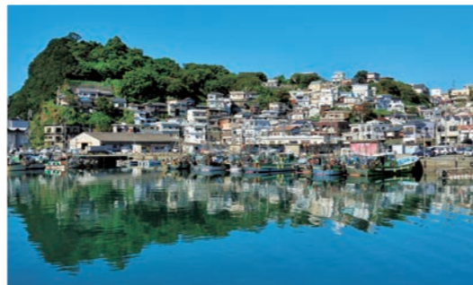
(左) 觀海閣，位於妹背山，是紀三井寺的前殿，由德川賴宣公建造 (中) 從雜賀崎遠望番所庭園。景觀壯美，視野開闊、動感十足 (右) 雜賀崎的一道獨特風景，成排的建築緊密地貼在陡峭的地形上

和歌之浦位於和歌山市的南部，以和歌川河口的海灘為中心，散布著雜賀崎、熊野參詣道紀伊路・藤白坡等景點，風光秀麗，歷史底蘊深厚。備受以萬葉和歌詩人・山部赤人和柿本人麻呂為代表的文人墨客所喜愛，在此創作了許多和歌。打動人心的抒情風景從不因時代的更迭而改變，總讓人為之著迷，還孕育了多元化的藝術。